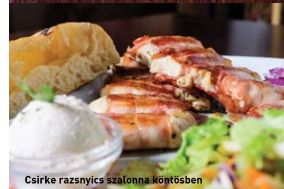
Csirke razsnyics szalonna köntösben