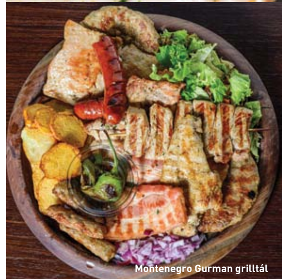
Montenegro Gurman grilltál