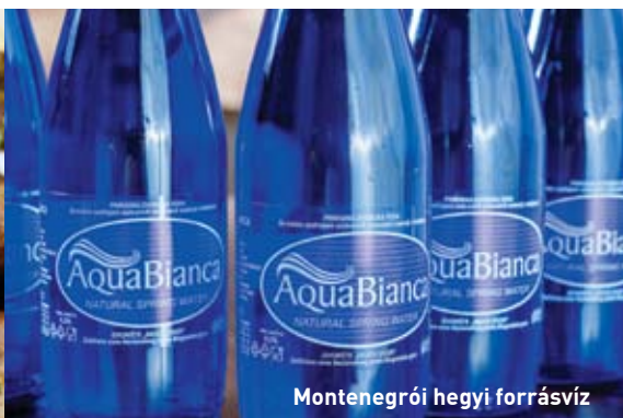
Montenegrói hegyi forrásvíz