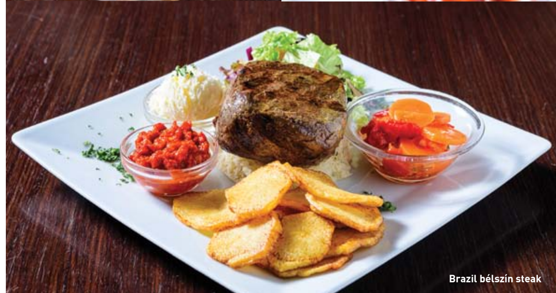
Brazil bélszín steak