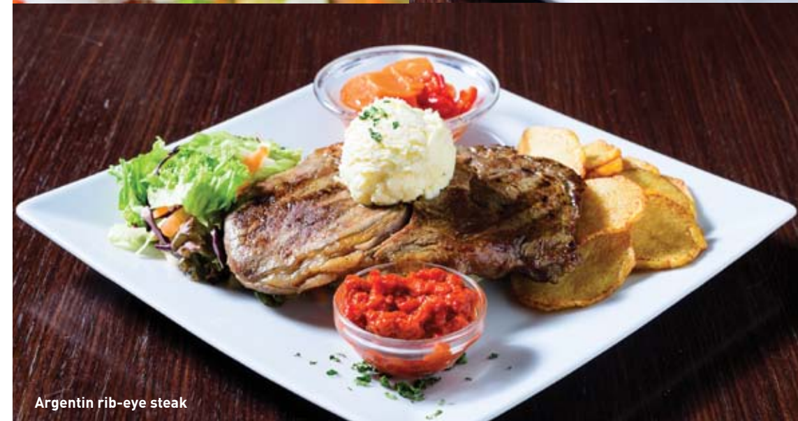
Argentín rib-eye steak