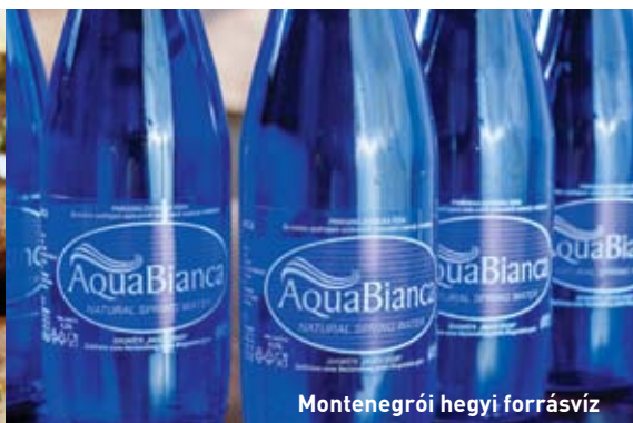
Montenegrói hegyi forrásvíz